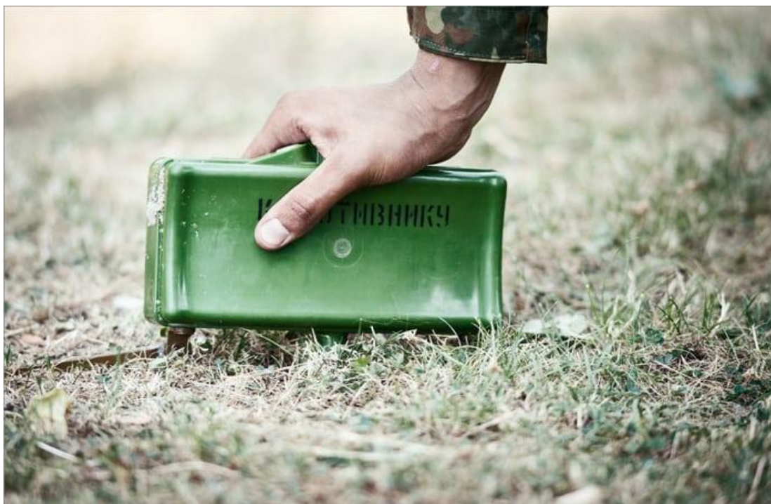
Мина в боевом положении