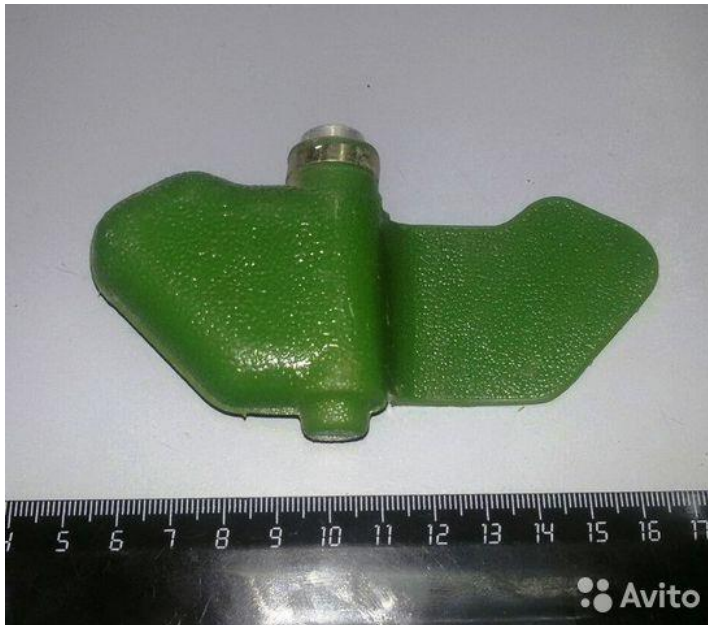
«Мина – ЛЕПЕСТОК» в боевом положении на земле (присыпана грунтом):